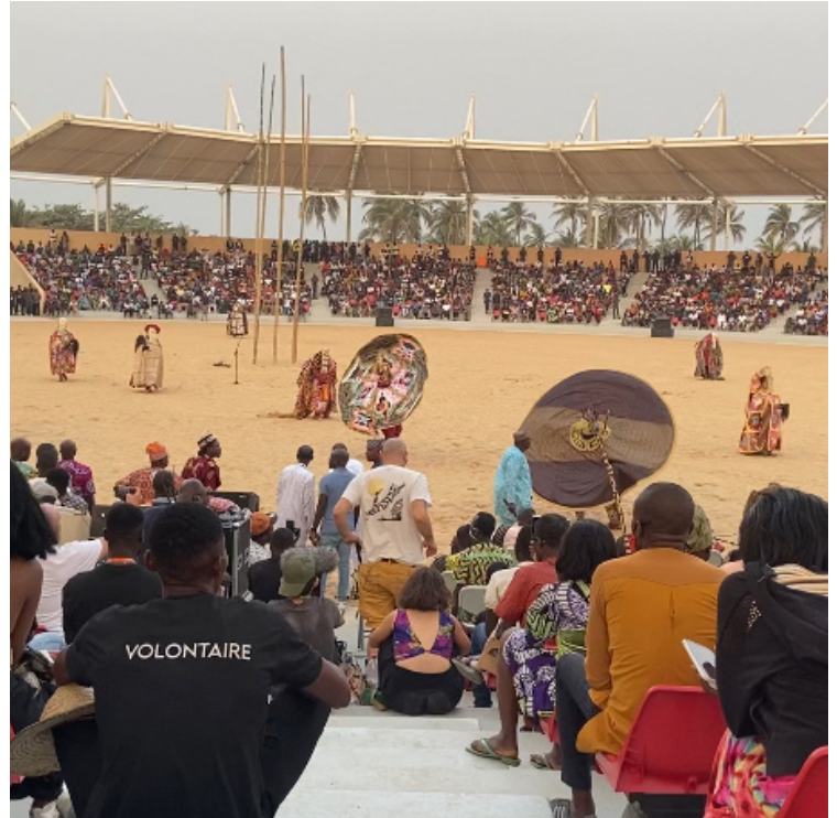
Inauguration du stade et danses traditionnelles vaudoues

Le projet du biodigesteur est quant à lui implanté dans la commune de Bonou, située également dans la vallée de l'Ouémé. Le principe repose sur la valorisation des déchets organiques : en l'absence d'oxygène (environnement anaérobie), ces déchets se décomposent pour produire du méthane, utilisable comme gaz de cuisson, et du digestat, qui sert de fertilisant naturel. Ce biodigesteur sera installé dans une école, afin d'alimenter en gaz la cantine scolaire et de fertiliser le jardin pédagogique.