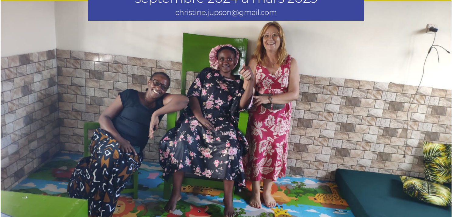
Moment de détente entre collègues lors de la finalisation de l'installation de la garderie.

L'association DM est active dans l'agroécologie, l'éducation et la théologie en Afrique, en Amérique latine, au Moyen-Orient, dans l'océan Indien et en Suisse.