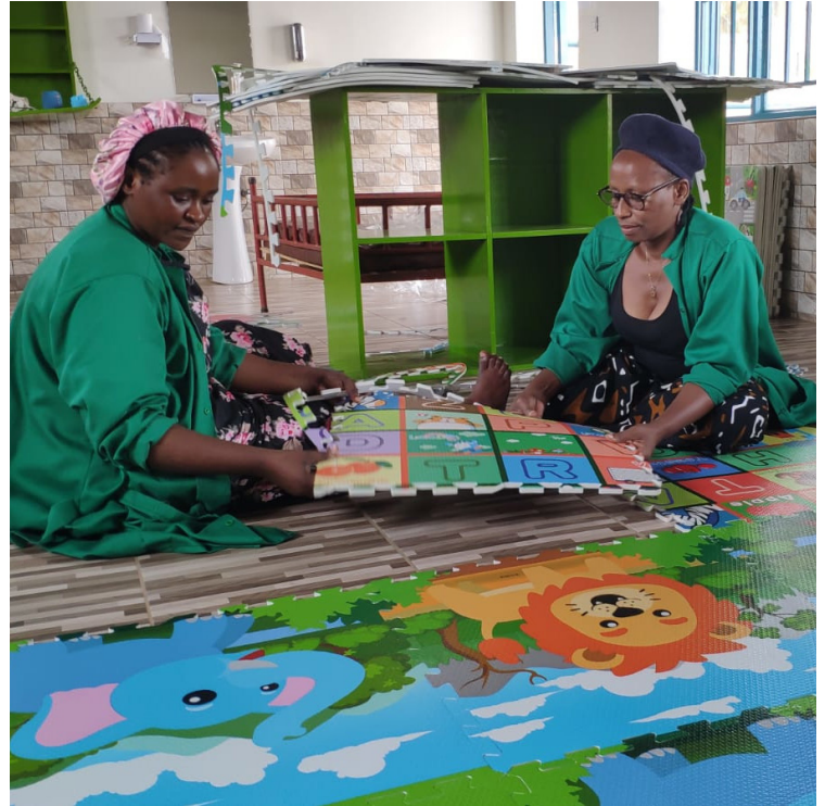
L'installation et la mise en place finale de la garderie