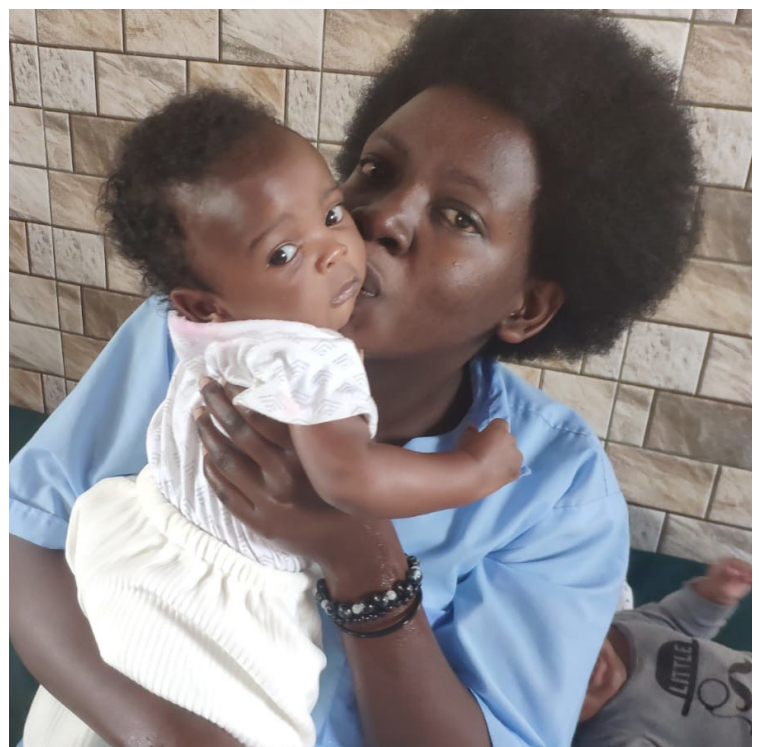
Moment câlin entre une maman et son enfant