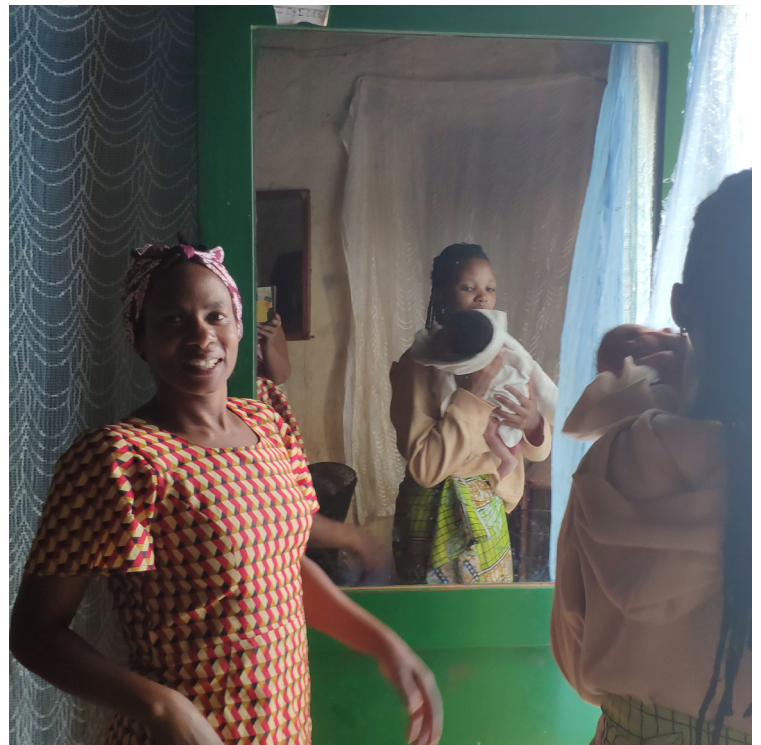
Famille d'accueil d'une maman

Une famille m'a particulièrement touchée. Les membres de cette famille ont accueilli il y a quelques jours une toute jeune maman de 16 ans qu'ils ont appris à connaître à l'hôpital, suite à son accouchement. Elle était sans famille, ami.es. Toute seule, abandonnée par sa propre maman. Elle a perdu son travail suite à sa grossesse et elle vivait dans la rue. Son histoire de vie commence petite fille par l'abandon de son père alors qu'elle n'était encore qu'un bébé, puis de sa maman. Elle ne sait pas où celle-ci vit : elle est partie au Burundi, semblerait-il. Suite à cela, elle a été recueillie par une vieille dame qui l'a élevée. Après le décès de cette vieille dame, la fille s'est retrouvée sans domicile. Elle n'a pas d'acte de naissance pour elle-même, elle ne connaît pas son âge exact... Et la voici maman à son tour. Son bébé n'a pas été inscrit à l'état civil, le CPAJ va s'en charger ultérieurement. La famille d'accueil de cette jeune maman et de son bébé de quelques semaines a elle aussi des difficultés financières. Le papa n'a pas de travail, les deux garçons sont en âge de scolarité primaire. Ils ont dit vouloir accueillir cette jeune maman définitivement. Ils sont chrétiens, ils disent que Dieu leur donnera ce dont ils auront besoin tous les jours. Ils m'ont autorisée à prendre des photos et à les diffuser pour faire connaître leur histoire.