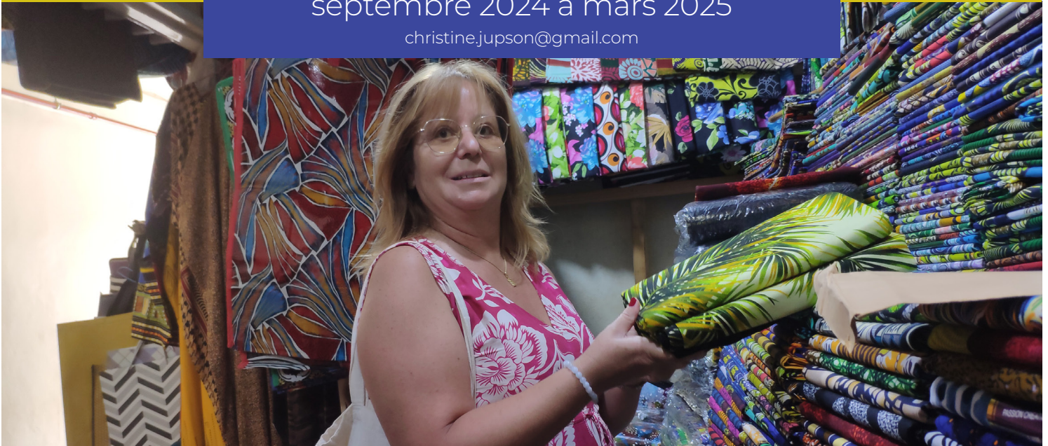
Achat de fournitures pour l'aménagement de la nurserie

L'association DM est active dans l'agroécologie, l'éducation et la théologie en Afrique, en Amérique latine, au Moyen-Orient, dans l'océan Indien et en Suisse.