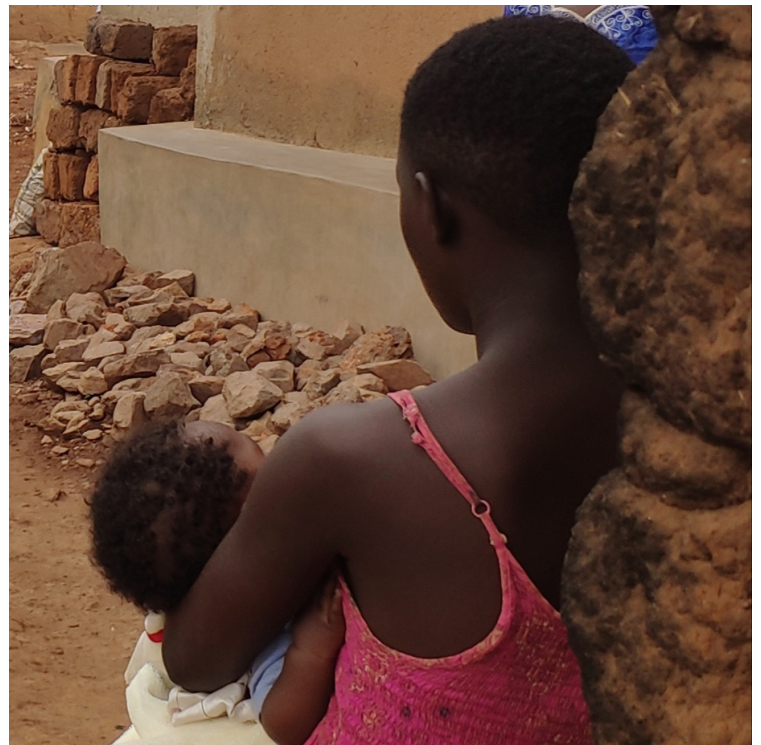
Jeune maman et son bébé, photo prise dans son quartier

Ma mission consiste à participer à l'encadrement et à l'amélioration des conditions d'accueil des enfants durant le temps des cours de ces jeunes mamans. Ma contribution comprend l'accompagnement des rénovations et de l'aménagement de l'espace de puériculture adapté, le développement de l'offre de matériel et de jeux d'éveil et de motricité, etc. Il y a également un partenariat avec l'équipe éducative afin de réfléchir aux objectifs et contenus des cours donnés aux mamans. En effet, j'ai déjà pu identifier des besoins en termes de formation : une approche avec le planning familial, des cours de sexualité, des thématiques comme l'hygiène, la nutrition, la maternité, la puériculture, etc. Cela me permettra aussi d'appuyer l'équipe sociale du Centre dans l'accueil et l'accompagnement individuel des filles mères. Nous avons d'ailleurs commencé à visiter les mamans dans leur contexte de vie.