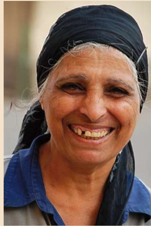
Chrétienne copte sur le parvis de la cathédrale Saint-Marc au Caire [lire la rubrique Christianisme pages 6-7]