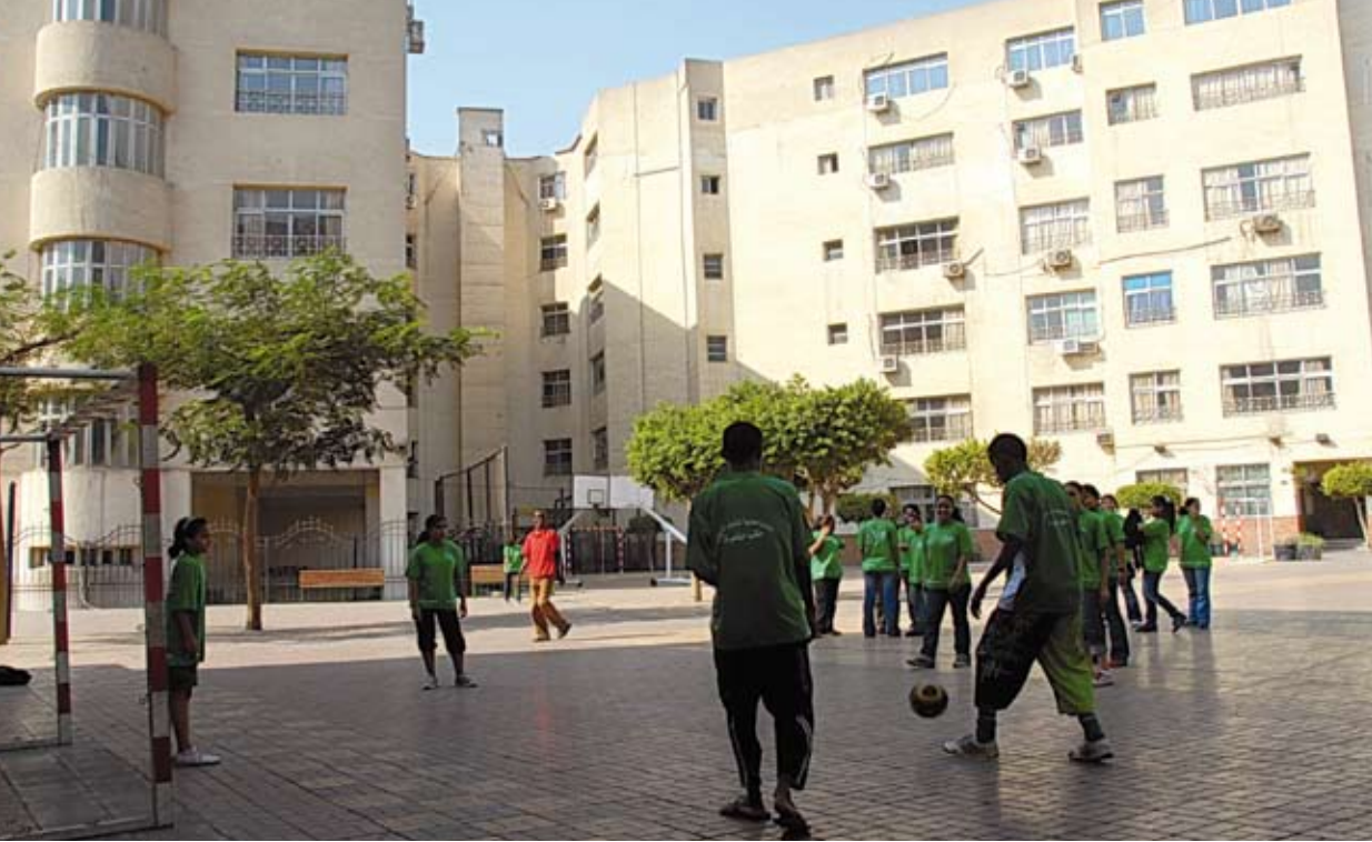
Le New Ramses College , extension mixte du Ramses College for girls , piloté le Synode du Nil.