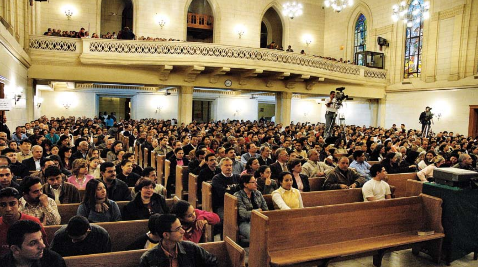
Un culte dans la paroisse protestante copte évangélique de Kasr El Doubara , au centre du Caire. On compte entre 500 000 et 1 million de protestants égyptiens, toutes Eglises confondues.