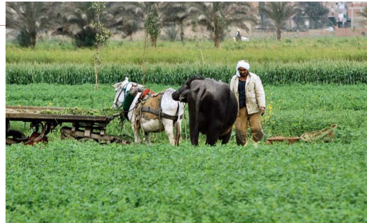
◀ Paysan du delta du Nil. « L'essentiel pour l'Égypte des années à venir ? La prospérité du pays. »