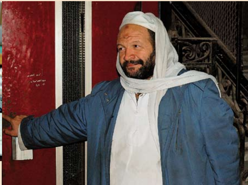
Gardien d'immeuble, rue Chérif, au coeur du Caire [lire la rubrique Société pages 4-5]

Le Levant n° 101 | 83 e année: revue annuelle de l'Action Chrétienne en Orient, 7 rue du Général Offenstein, 67000 Strasbourg | +33 (0)3 88 40 27 98 | aco.france@gmail.com | www.aco-fr.org | CCP: 135 36 Y Strasbourg.