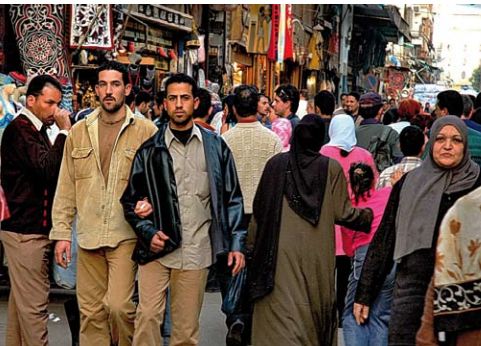
Dans les rues du vieux Caire. « Dans le cas de l'Égypte, la culture pharaonique, l'Église copte et l'Islam ont tous leur contribution à apporter à une société pluraliste. »

On pourrait conclure que le printemps arabe s'est transformé en un printemps islamique, comme le montre l'arrivée des islamistes au pouvoir. Mais cer-