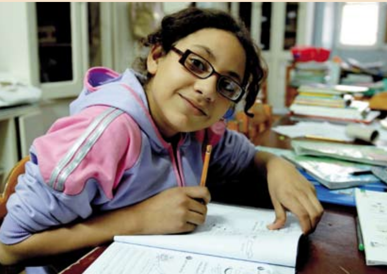
Résidente de l'orphelinat Fowler au Caire [lire les rubriques Paroles d'envoyés et Solidarité pages 20-22]